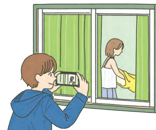
こっそり写真を撮る