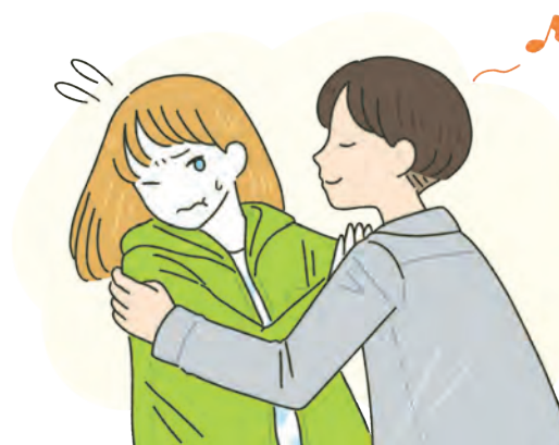
相手の同意なしでキスをする