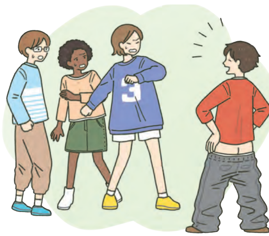
性器を人に見せる