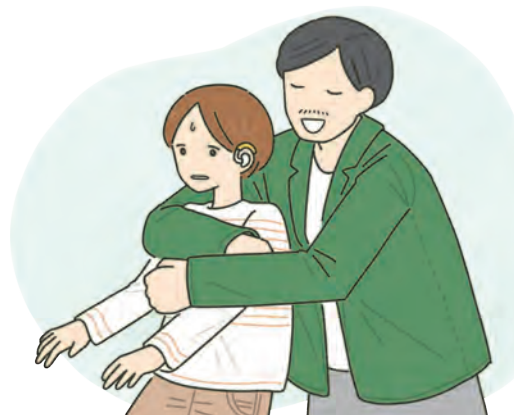
相手の同意なしで抱きつく