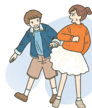
スカートをめくる