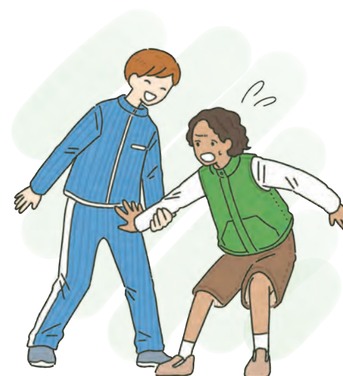
むりやり性器をさわらせる