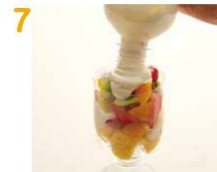
最後に4を絞り入れます。