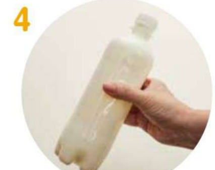
ふたを閉め、とろりとするまでふって泡立ってます。