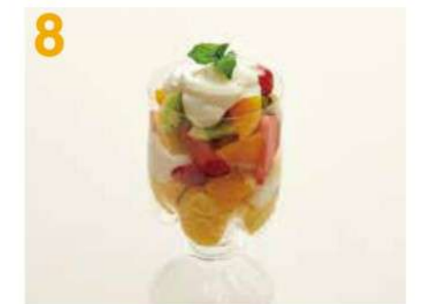
ミントをのせます。