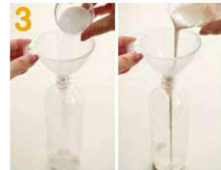
混ぜる用ペットボトルに砂糖、生クリームを入れます。