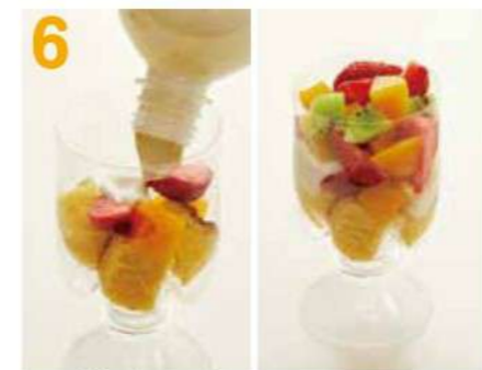
4を絞り入れ、残りのカステラ、フルーツを入れます。