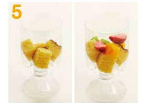
パフェグラスにカステラを入れ、フルーツを入れます。