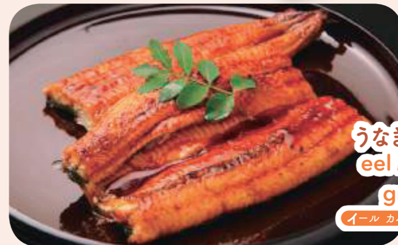
うなぎのかば焼き eel kabayaki / grilled eel