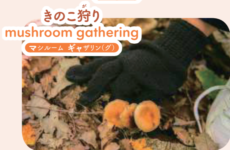
きの こ 狩 り きのこ狩り mushroom gathering マシルーム ギャザリン(グ)