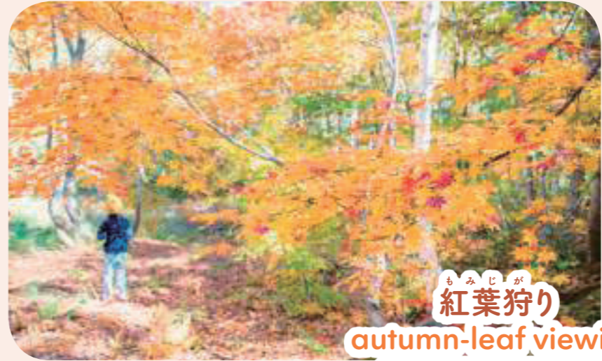
も み じ が 紅葉狩り autumn-leaf viewing オータム リーフ ヴューイン(グ)