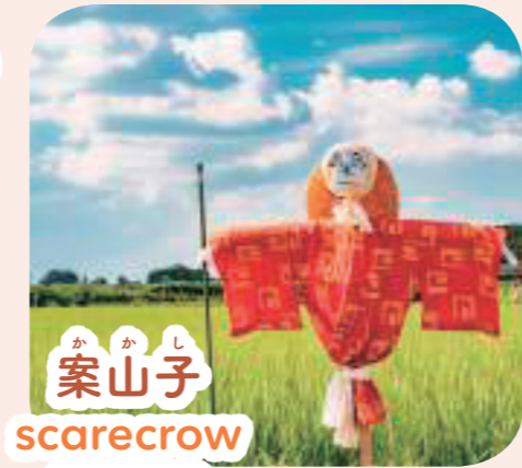
か かし 案山子 scarecrow スケアクロウ