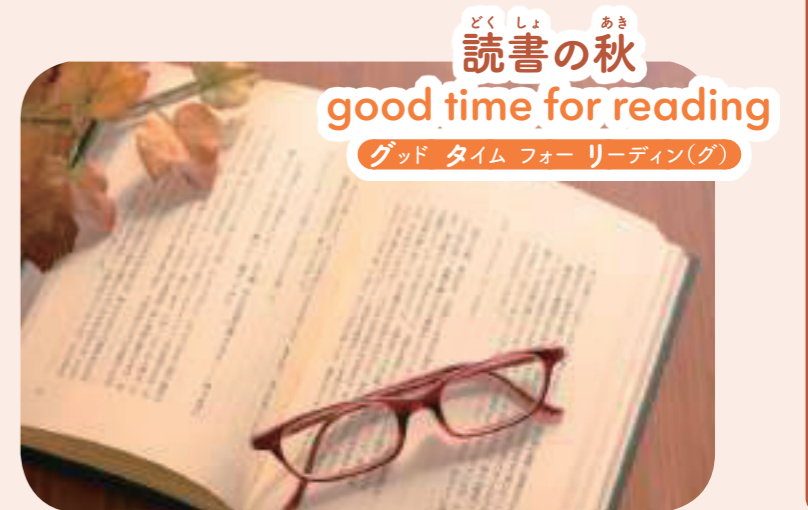
どく しょ あ き 読書の秋 good time for reading グッド タイム フォー リーディン(グ)