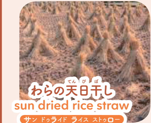
てん び ぼ わらの天日干し sun dried rice straw サン ドゥライド ライス ストロー