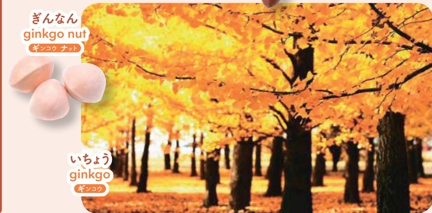
ぎんなん ginkgo nut ギンコウ ナット