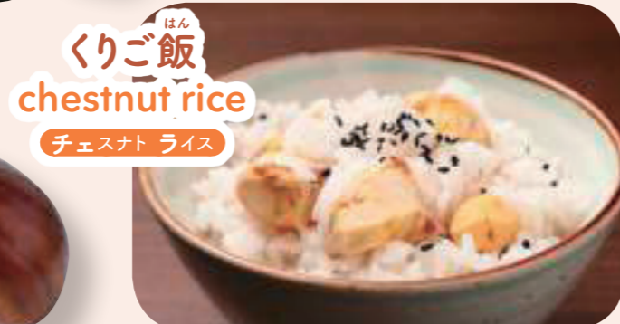
くりご飯 chestnut rice