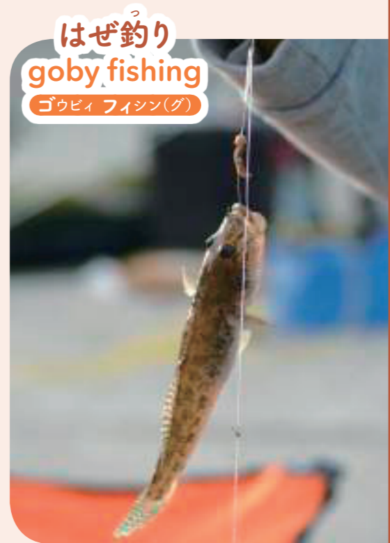
は ぜ 釣 り はぜ釣り goby fishing ゴウビィ フィシン(グ)