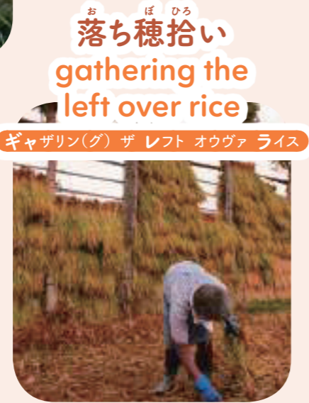
お ぼ ひろ 落ち穂拾い gathering the left over rice ギャザリン(グ) ザ レフト オウヴァ ライス