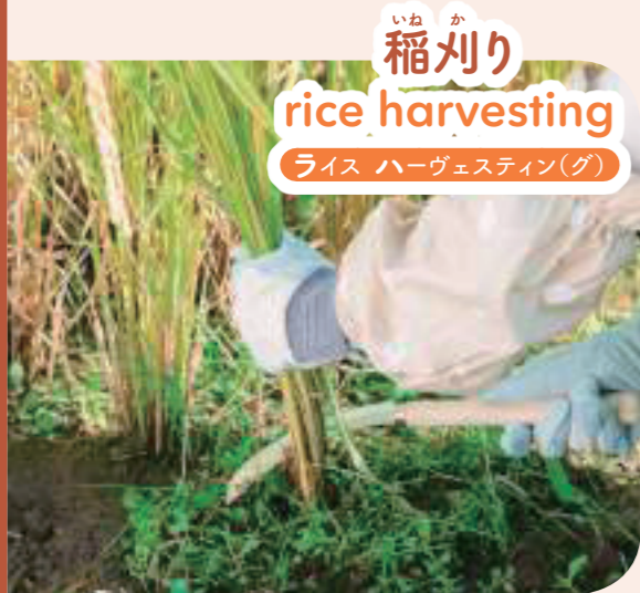
いね か 稲刈り rice harvesting ライス ハーヴェスティング(グ)