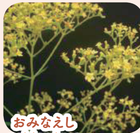
おみなえし golden lace ゴウルドゥン レイス

あき さ だいひょうてき しゅ くさばな はる ななくさ た ぐさ に対して み たの くさ として えら ばれている。