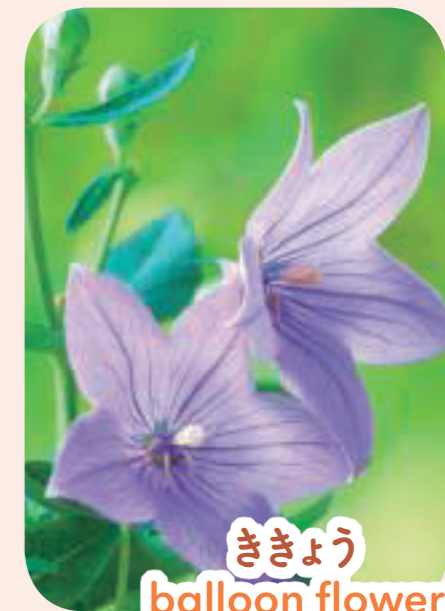
ききょう balloon flower バルーン フラウア