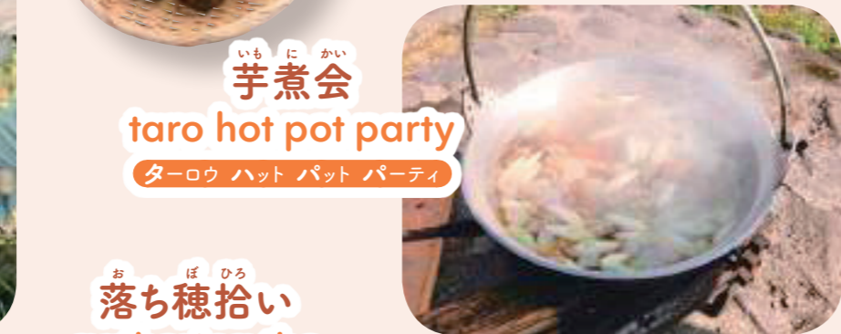
いも に かい 芋煮会 taro hot pot party ターロウ ハット パット パーティ