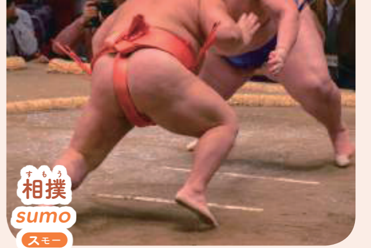
すもう 相撲 sumo スモー