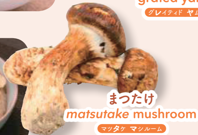
まつたけ matsutake mushroom