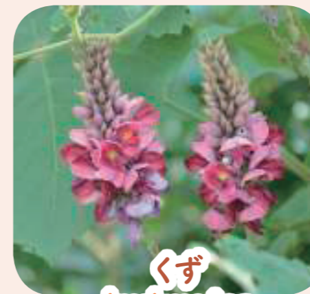
くず kudzu vine クズ ヴァイン