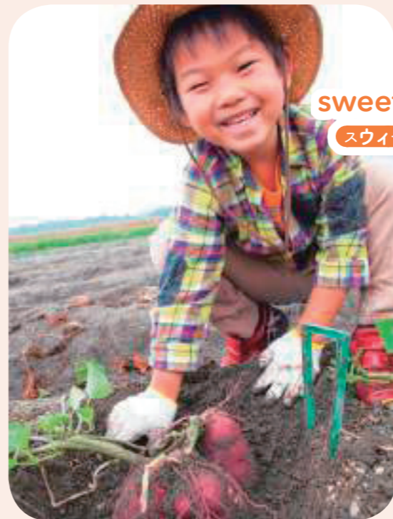
いも ほ 芋掘り sweet potato digging スウィート ポテイトウ デイギン(グ)