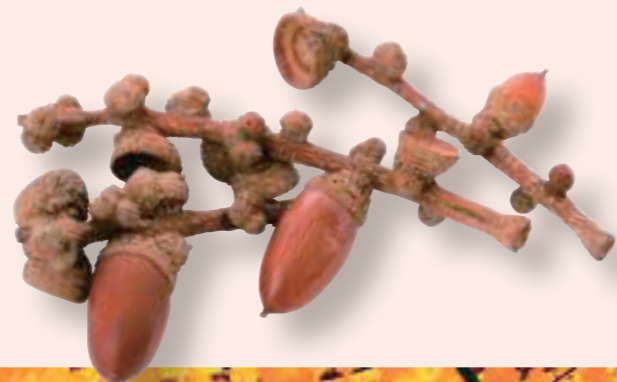
どんぐり acorn エイコーン