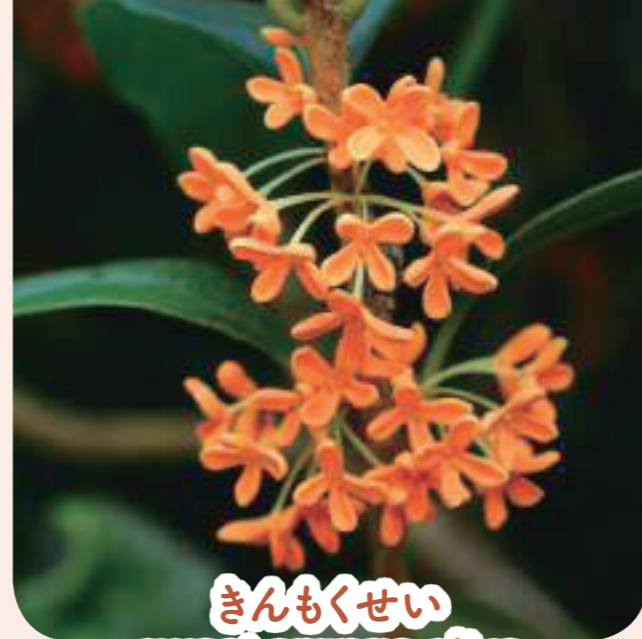
きんもくせい sweet orange olive スウィート オーレンヂ アリヴ