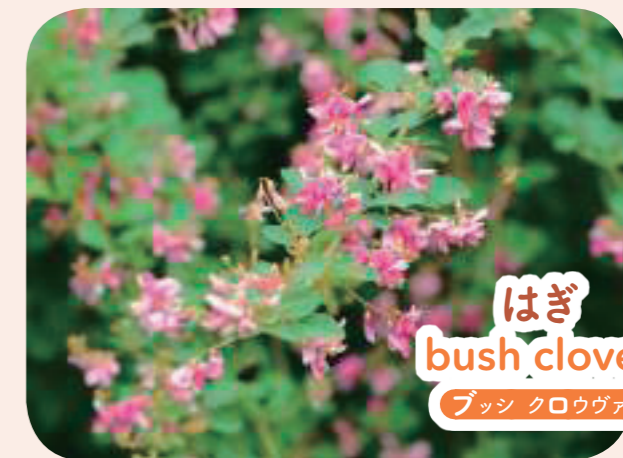
はぎ bush clover ブッシ クロウヴァ