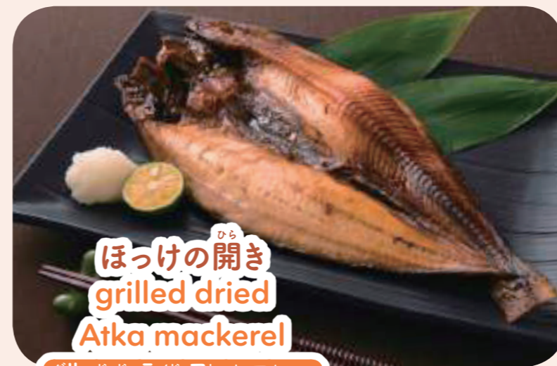
ほっけの開き grilled dried Atka mackerel