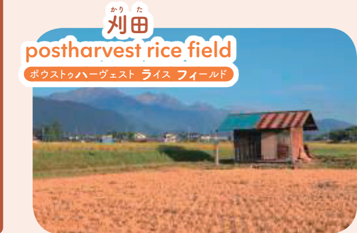
かり た 刈田 postharvest rice field ポウストゥハーヴェスト ライス フィールド