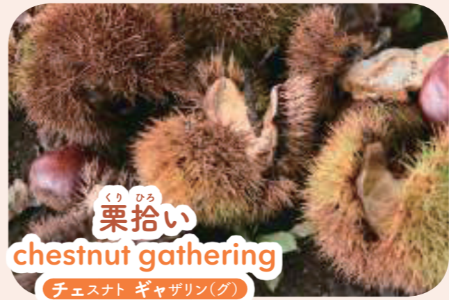
くり ひろ 栗拾い chestnut gathering チェスナト ギャザリン(グ)