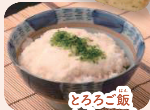
とろろご飯 grated yam rice